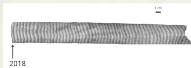
Abbildung 1: Positiv-Abzug der Röntgenaufnahme eines Korallenbohrkerns (Ausschnitt). Hell dargestellte Bereiche weisen eine geringere Dichte auf.

Erläutern Sie das Zustandekommen der auf dem Korallenbohrkern zu sehenden Ringe; unterscheiden Sie dabei helle und dunklere Abschnitte.